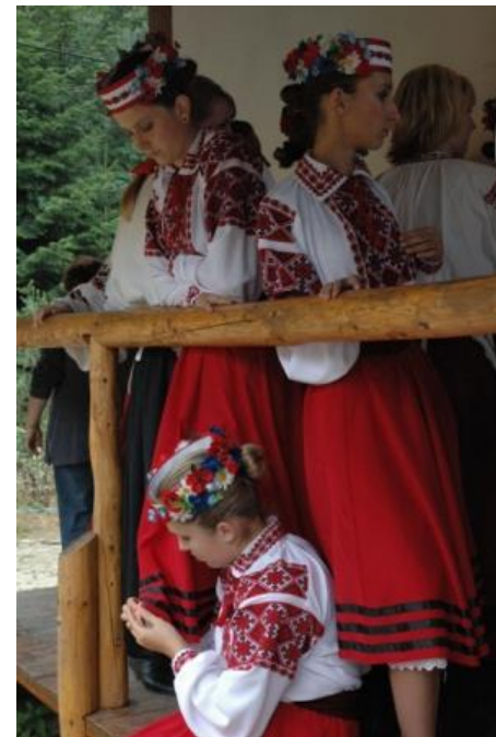
Zdjęcie: Zespół "Ranok" z Bielska Podlaskiego na zapleczu sceny Watry w Zdyni, fot. Anna Kertyczak 2005.

* warto dodać, że pojęcia wielokulturowość i multikulturalizm często są używane wymiennie i są traktowane jako synonimy; można jednak spotkać i odmienne podejście, w którym wielokulturowość postrzegana jest jako stan społeczeństwa, który cechuje zróżnicowanie kulturowe, natomiast multikulturalizm to idea, zgodnie z którą zróżnicowane kulturowo grupy w danym społeczeństwie mogą manifestować swoją „inność”/odmienność kulturową, a jednocześnie w pełni uczestniczą w życiu tego społeczeństwa.