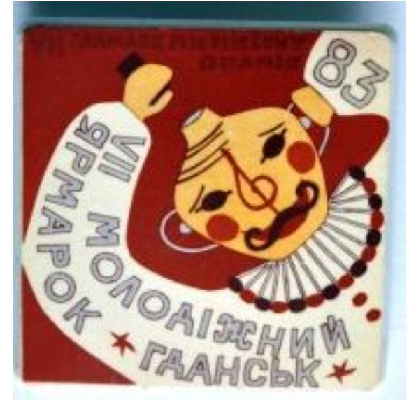
Przypinka z VII Młodzieżowego Jarmarku ukraińskiego Gdańsk 1983.

Rok 1989 i następujący po nim wybuch pluralizmu (organizacyjnego, tożsamościowego, regionalnego) to finał tego procesu.