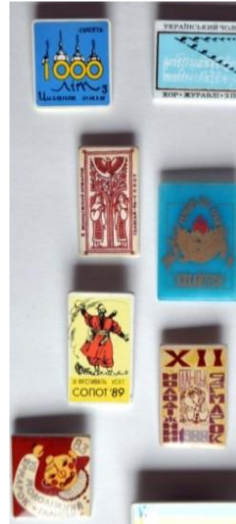
Na zdjęciu pamiątkowe przypinki z ukraińskich wydarzeń kulturalnych I. 1980-90.

Ukraińskie Towarzystwo Społeczno-Kulturalne zastosowało wówczas praktykę okrągłych stołów – spotkań, które miały przynieść wypracowywanie nowej formuły działalności. Ostatecznie zdecydowano się na jedną wiodącą organizację (Związek Ukraińców w Polsce jest prawnym następcą UTSK), w ramach której działały organizacje branżowe (historycy, lekarze), regionalne (oddziały i koła Związku), czy młodzieżowe (Płast – organizacja skautingu ukraińskiego). Równoległe, choć nie od razu, wyodrębniły się i powstawały inne organizacje mniejszości ukraińskiej, dziś jest ich kilka.